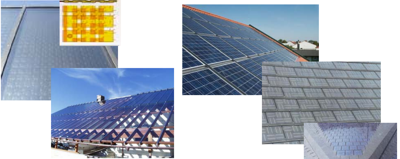
Solardächer für Warmwasser und Heizung

(100%-ige Energieversorgung mit Strom und Wärme aus nachwachsenden Rohstoffen und aus der Sonne)