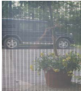
Solarstromdächer Fassaden transparente Module