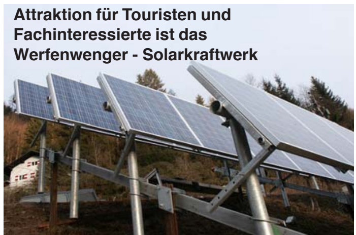
Attraktion für Touristen und Fachinteressierte ist das Werfenwenger - Solarkraftwerk

Standort: Werfenweng Eulersberg 1 Land Salzburg 980 m ü.M