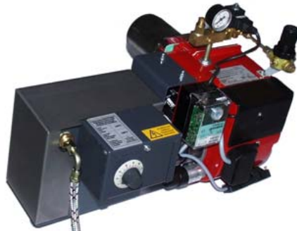
Strom und Wärme mit